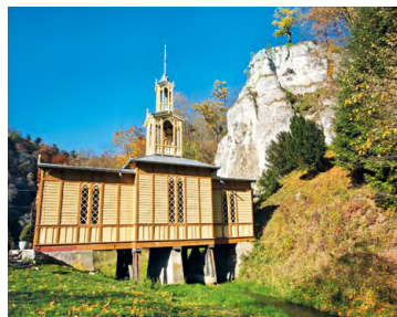
Kaplica na Wodzie

6,3 D Kaplica na Wodzie – unikatowy drewniany budynek w stylu szwajcarsko-ojcowskim wzniesiono w 1901 r. Aby obejść zakaz cara Mikołaja II dotyczący budowy obiektów sakralnych na ziemi ojcowskiej, posadowiono go na podporach ponad nurtem Prądnika.