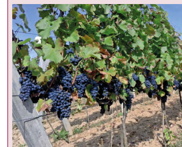
Winnica Nad Prądnikiem

położona jest w Prądniku Korkziowskim. Obecnie plantacja liczy 40 arów, na których uprawia się około 1500 krzewów winorośli, w tym szczepy: regent i rondo (na wina czerwone i różowe) oraz seyval blanc , jużrenka i solaris (na wina białe). W gospodarstwie oprócz win skosztować można: sezonowych miodów z pasieki, miodów pitnych, własnego wyrobu chleba i konfitur. W miejscu gdzie obecnie