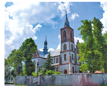
Kościół w Smardzowicach

31,9 L Smardzowice, Sanktuarium MB Smardzowickiej – w neogotyckim kościele wybudowanym w 1918 r. znajduje się taskami słynący obraz Matki Bożej z Dzieciątkiem z XV w.