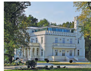
Dwór Dobieckich w Cianowicach

29,5 K Cianowice, dwór Dobieckich – neogotycka budowla wzniesiona pod koniec XIX w., odbudowana po wojnie.