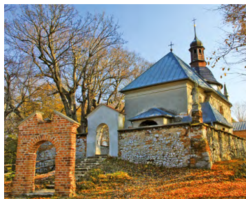
Kościół i pustelnia bł. Salomei

8,0 Możliwość skrócenia trasy. W tym celu należy skręcić w prawo, na Skatę. Niestety pojedziemy ruchliwą drogą wojewódzką z wymagającym podjazdem.