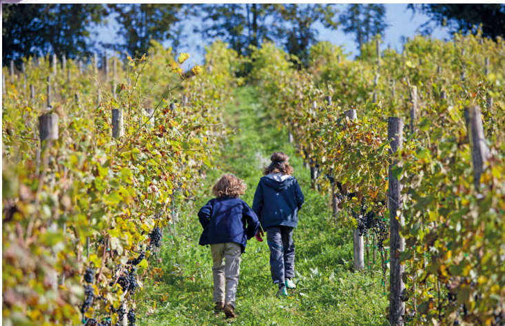
Winnica św. Jana

Na wina białe uprawia się tu odporne krzyżówki, jak: aurora , seyval blanc , krystały i swenson red , a także swoją jutrzenkę . Na terenie winnicy znajduje się wygodne miejsce do degustacji w przebudowanej na winiarnię starej stodole.