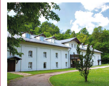
Muzeum Ojcowskiego Parku Narodowego

5,8 B Ojców, Muzeum Ojcowskiego Parku Narodowego – muzeum