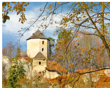
Zamek w Ojcowie

6,0 C Ojców, zamek – malowniczo wkomponowane w skały ruiny zamku pochodzą z fundacji Kazimierza Wielkiego z XIV w. Obiekt można zwiedzać. Ze wzgórza roztacza się urokliwy widok na Dolinę Prądnika.